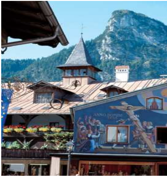
Centro storico Oberammergau

MOTOCLUB ABBIATEGRASSO VIA CANONICA, 4 (20081) ABBIATEGRASSO (MI) WWW.MOTOCLUBABBIATEGRASSO.COM